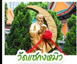
วัดเซกกงเมิว