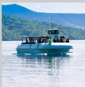
“LAKE SHIKOTSU GLASS BOAT”