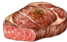
● ไม่ทานเนื้อหมู