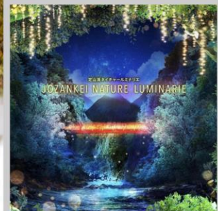
“JOZANKEI NATURE LUMINARIE”