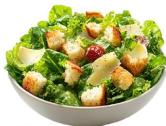
● ผักสดวิธีตี