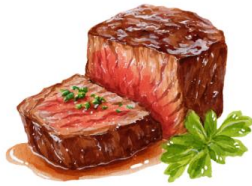
● ไม่ทานเนื้อวัว

ขอความกรุณาแจ้งวัตถุประสงค์ที่ท่าน แพ้หรือไม่สามารถรับประทานได้