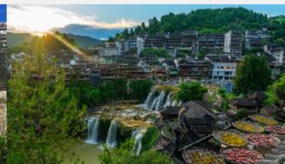
หมู่บ้านโบราณฝูหรงเจิ้น

*ทางบริษัทฯ ขอสงวนสิทธิ์ในการสลับโปรแกรมทัวร์ตามความเหมาะสมขึ้นอยู่กับสถานการณ์หน้างาน โดยคำนึงถึงผลประโยชน์ของลูกค้าเป็นสำคัญ