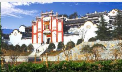
บ้านเกิดชวีหยวน