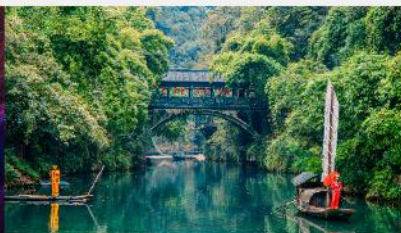
หมู่บ้านซานเสีเหรินเจีย