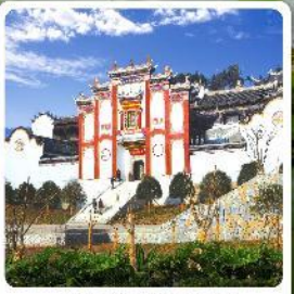
บ้านเกิดชวีหยวน