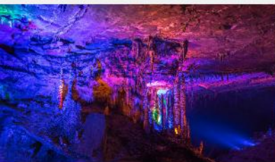
ต้าเก้าเทพ