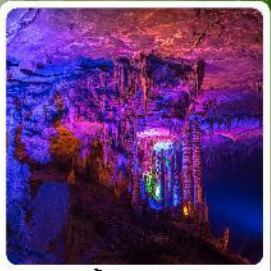
ถ้ำกำเทพ