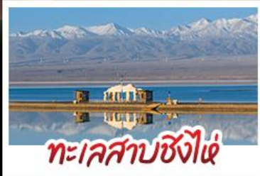
ทะเลสาบซิงไห่