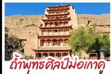
กำแพงพุทธศิลป์ม่อเกาดู

เป็นทรายครวญ - สระน้ำงพระจันทร์ ทะเลสาบเกลือฉาซ่า - กำพุทธรศิลป์ม่อเกาดู หุบเขาสายรุ้งจางเย่ - ทะเลสาบซิงไห่