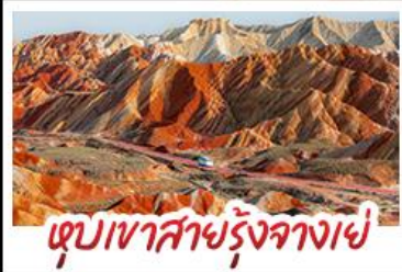
หุบเขาสายรุ้งจางเย่