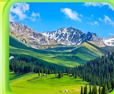
"ทุ่งหญ้านาราตี"