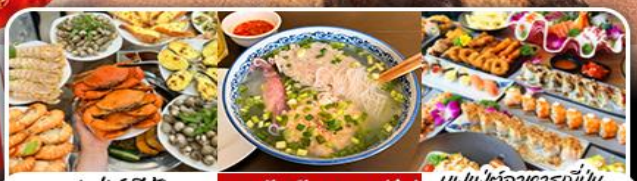
บุฟเฟ่ต์ซีฟู้ด | เมนูจีนเวียดนาม (บุ๊ต) | บุฟเฟ่ต์อาหารญี่ปุ่น Bababa Japanese Restaurant