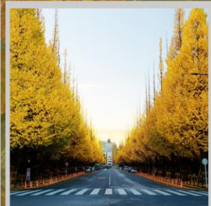
"ICHONAMIKI GINGO AVENUE"