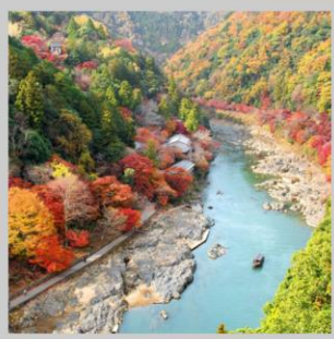
“ARASHIYAMA MT. KAMEYAMA”