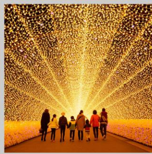
“NABANA NO SATO”