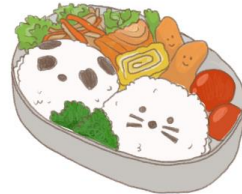
● อาหารสำหรับเด็ก ( 2-11 ปี ) *วัตถุประสงค์ขึ้นอยู่กับทางร้าน