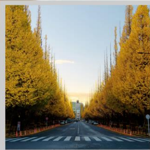
“ICHONAMIKI GINGO AVENUE”