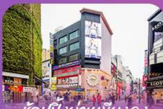
ช้อปปิ้งย่านเมียงดง