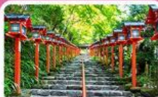
ศาลเจ้าคิฟูเนะ