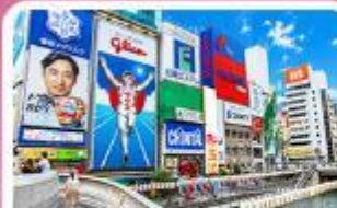
ชิบโซบาชิ