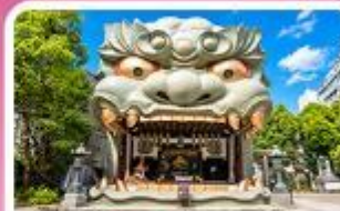
ศาลเจ้านิมมะ ยาชากะ