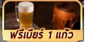
ฟรีเบียร์ 1 แก้ว