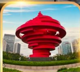
จตุรัสห้าสี