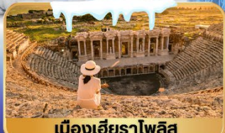
เมืองเฮียราโพลิส