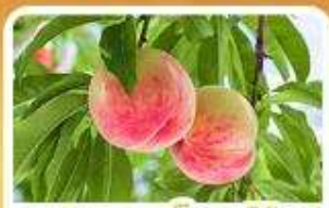
กิจกรรมเก็บผลไม้