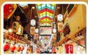
ตลาดปลาเนชิกิ