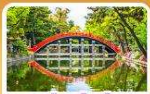
ศาลเจ้าสุมิโยชิ โกเบ