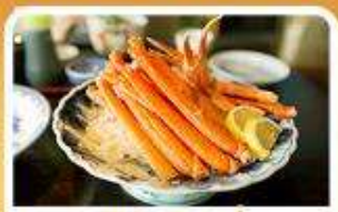
พิเศษ! ชาบู