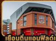
เยือนต้นแอนฟิลด์และโอลด์แทรฟฟอร์ด

London Stonehenge Liverpool Manchester Stratford Upon Avon