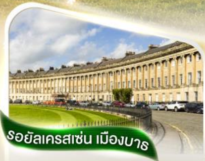
รอยัลครอสเช่น เมืองบาร