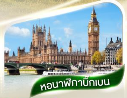
หอนาฬิกาบิกเบน