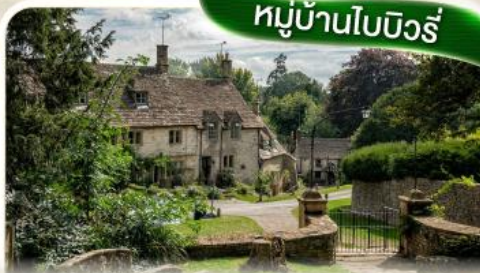
หมู่บ้านไบบิวรี่