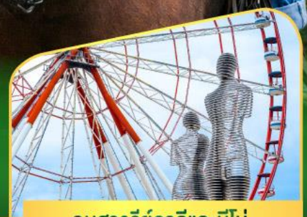
อนุสาวรีย์อาลีและนีโน่