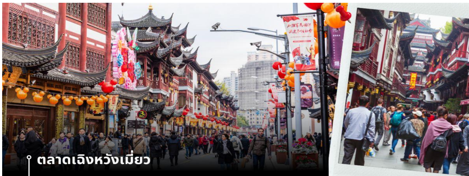
📍 ตลาดเจิ้งหวังเมี่ยว

จากนั้นนำท่านสู่ ตลาดเจิ้งหวังเมี่ยว เป็นศูนย์รวมสินค้า และอาหารพื้นเมืองที่แสดงถึงเอกลักษณ์ของชาวเซี่ยงไฮ้ซึ่งมีการผสมผสานระหว่างอดีตและปัจจุบันได้อย่างลงตัว ซึ่งเป็นย่านสินค้าราคาถูกที่มีชื่ออีกย่านหนึ่งของนครเซี่ยงไฮ้ ให้ท่านอิสระช้อปปิ้งตามอัธยาศัย