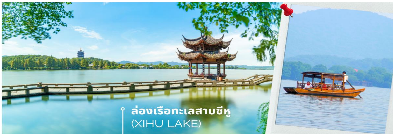
ล่องเรือทะเลสาบซีหู (XIHU LAKE)

นำท่านเดินทางสู่ เมืองหางโจว ใช้เวลาเดินทางประมาณ 2 ชั่วโมง (HANGZHOU) หรือ ฮังโจว เป็นเมืองที่ตั้งอยู่ในประเทศจีน ซึ่งตั้งอยู่ทางตอนตะวันออกของประเทศ เมืองหางโจวเป็นเมืองเก่าแก่ 1 ใน 6 ของประเทศจีน ปัจจุบันหางโจว ถือเป็นเมืองที่อยู่ในเขตภาคตะวันออกที่ได้รับการพัฒนาอย่างสูงสุดแล้ว ดังนั้นหางโจวจึงเป็นที่รู้จักกันเป็นอย่างดีว่าเป็นเมืองที่มีความสำคัญทางเศรษฐกิจ มีวัฒนธรรมที่ยาวนานและเป็นเมืองที่มีทัศนียภาพที่สวยงามเมืองหนึ่งของประเทศจีน นำท่าน ล่องเรือทะเลสาบซีหู (XIHU LAKE) ตั้งอยู่ในเมืองหางโจว ที่นี่สามารถล่องเรือชมความงามของทะเลสาบซีหู นอกจากทิวทัศน์อันงดงามแล้วทะเลสาบแห่งนี้ยังเป็นจุดเริ่มต้นเรื่องราวของ “นางพญางูขาว” ตำนานแห่งความรักสุดยิ่งใหญ่ที่ถูกนำมาทำเป็นภาพยนตร์และละครเวทีที่โด่งดังไปทั่วโลก เมื่อล่องเรือบนทะเลสาบซีหูนอกจากธรรมชาติอันงดงามของทะเลสาบแล้ว สิ่งที่น่าสนใจผู้มาเยือนทะเลสาบแห่งนี้คงหนีไม่พ้น เจดีย์นางพญางูขาว หรือ