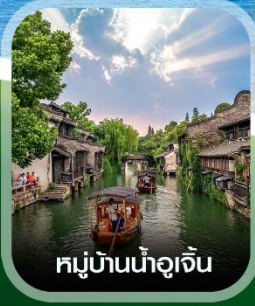
หมู่บ้านน้ำอูเจิน