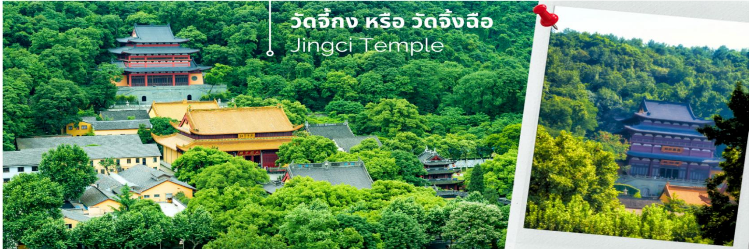
วัดจิ้งจิ้ง หรือ วัดจิ้งฉือ Jingci Temple

นำท่านเดินทางสู่ไร่ชาหลงจิ่ง แวะถ่ายรูปกับสวนใบชาหลงจิ่ง และจิบชาหลงจิ่ง สุดยอดใบชาในบรรดาชาทั้งหลายทั้ง