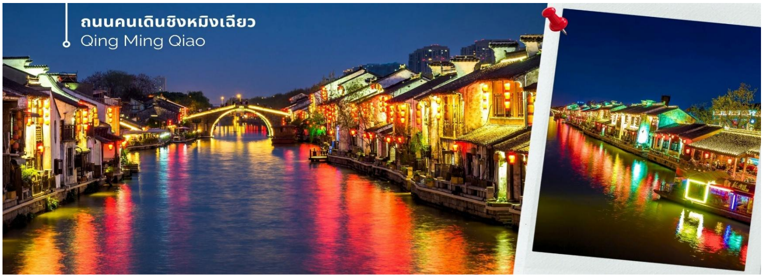
ถนนคนเดินชิงหมิงเฉียว Qing Ming Qiao

จากนั้นให้ท่านเดินชมบรรยากาศพื้นเมืองโบราณของ ถนนคนเดินชิงหมิงเฉียว เราจะได้เห็นบรรยากาศ บ้านเรือนสไตล์จีนโบราณ ร้านค้าต่างๆ ที่ขายสินค้าพื้นเมือง เสื้อผ้า ขนม ของประดับตกแต่ง ของฝาก ของที่ระลึกสวยๆ ให้เดินดูกันอย่างเพลิดเพลิน