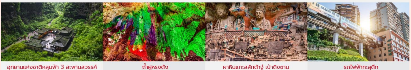
อุทยานแห่งชาติหลุมฟ้า 3 สะพานสวรรค์ กำแพงหงุดง ผาหินแกะสลักต้าจู่ เป่าตึงซาน รถไฟฟ้ากะลุดี้ก