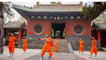
ชมโชว์กังฟูเล่าหลิน

*ทางบริษัทฯ ขอสงวนสิทธิ์ในการสลับโปรแกรมทัวร์ตามความเหมาะสมขึ้นอยู่กับสถานการณ์หน้างาน โดยคำนึงถึงผลประโยชน์ของลูกค้าเป็นสำคัญ