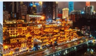
หงหยาดัง(ชมไฟยามค่ำคืน)

*ทางบริษัทฯ ขอสงวนสิทธิ์ในการสลับโปรแกรมทัวร์ตามความเหมาะสมขึ้นอยู่กับสถานการณ์หน้างาน โดยคำนึงถึงผลประโยชน์ของลูกค้าเป็นสำคัญ