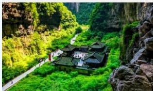
อุทยานแห่งชาติหลุมฟ้า