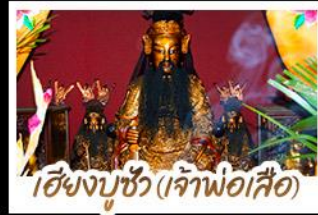
เซียงจูซิว (เจ้าพ่อเสือ)