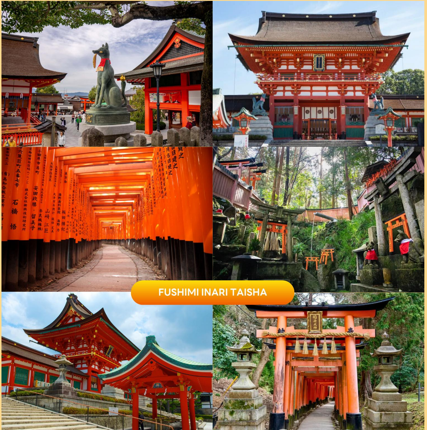
FUSHIMI INARI TAISHA

นำท่านสู่ ศาลเจ้าฟูชิมิอินาริ (Fushimi Inari Taisha) สร้างขึ้นเพื่ออุทิศแก่ อินาริ เทพเจ้าแห่งการเพาะปลูก และการค้า ที่รุ่งเรือง เป็นศาลเจ้าที่สำคัญที่สุดในบรรดาศาลเจ้าอินาริทั้งหมดในญี่ปุ่น แนวเสาประตูโทริอิสีส้มสดใสทอดยาวอย่างสุดตา ที่ทอดยาวขึ้นไปสู่ยอดเขาอินาริ ทำให้เกิดเป็นภาพอันน่าประทับใจ และเป็นหนึ่งในภาพที่โด่งดังของญี่ปุ่น ฟูชิมิอินาริโทยะนั้นเป็นทั้งศาลเจ้าของประชาชน และของราชสำนัก เป็นศาลที่พระจักรพรรดิหลายพระองค์มักแวะเวียนมาสักการะตั้งแต่ในอดีต ( การเปลี่ยนสีของใบไม้ ขึ้นอยู่กับสภาพอากาศเป็นสำคัญ )