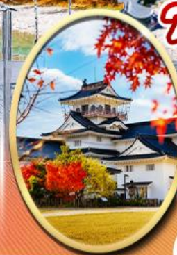
Mikimoto Pearl Island