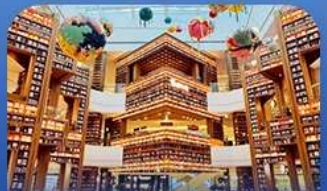
ต๋องกมุดคตาร์ทพีค