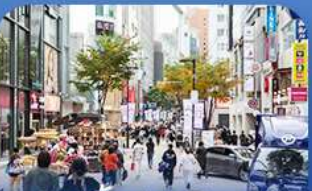
ช้อปบิงข่านเมียงดง