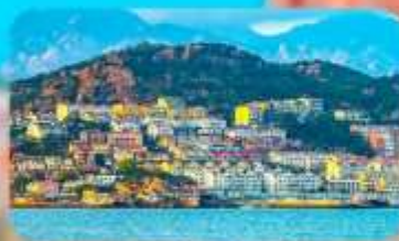
หมู่บ้านประมงชาจื่อโจว