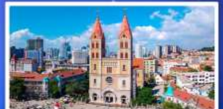
โบสถ์เซนต์โมเคิล