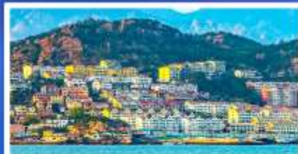
หมู่บ้านประมงซาโจว