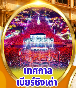
เทศกาล เบียร์ชิงเต่า