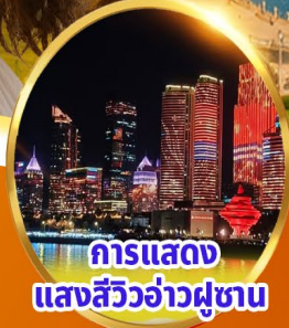
การแสดง แสงสีว้าวคู่ขนาน