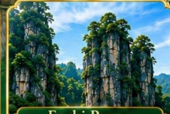
Enshi Puyan อุทยานหินเินช้อปูหย่า