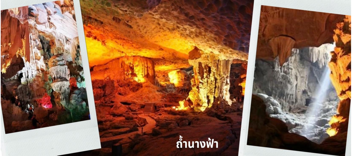
ถ้ำนางฟ้า

จะเห็นได้ว่าหินงอกหินย้อยต่าง ๆ นั้นจะมีลักษณะรูปร่างแตกต่างกันออกไปตามแต่ท่านจะจินตนาการ ขึ้นอยู่ว่าแต่ละท่านจะตีความออกมาว่าเป็นรูปร่างเหมือนสิ่งใด ในถ้าเราจะเห็นหินรูปร่างฟ้าที่ถูกสร้างขึ้นมาจากทางธรรมชาติที่ติดอยู่ภายในผนังถ้ำ นับว่าเป็นสิ่งมหัศจรรย์อย่างหนึ่งและมีตำนานเล่าขานกันว่า มีเหล่านางฟ้าเข้ามาอาบน้ำในถ้ำแห่งนี้และเกิดหลงไหลชายหนุ่มผู้ที่เป็นมนุษย์เลยคิดที่จะไม่ยอมกลับสวรรค์ จนกระทั่งเวลาผ่านไปล่วงเลยไปกลุ่มนางฟ้าทั้งหลายเลยกลายเป็นหินติดอยู่ที่ผนังถ้ำอย่างน่าอัศจรรย์