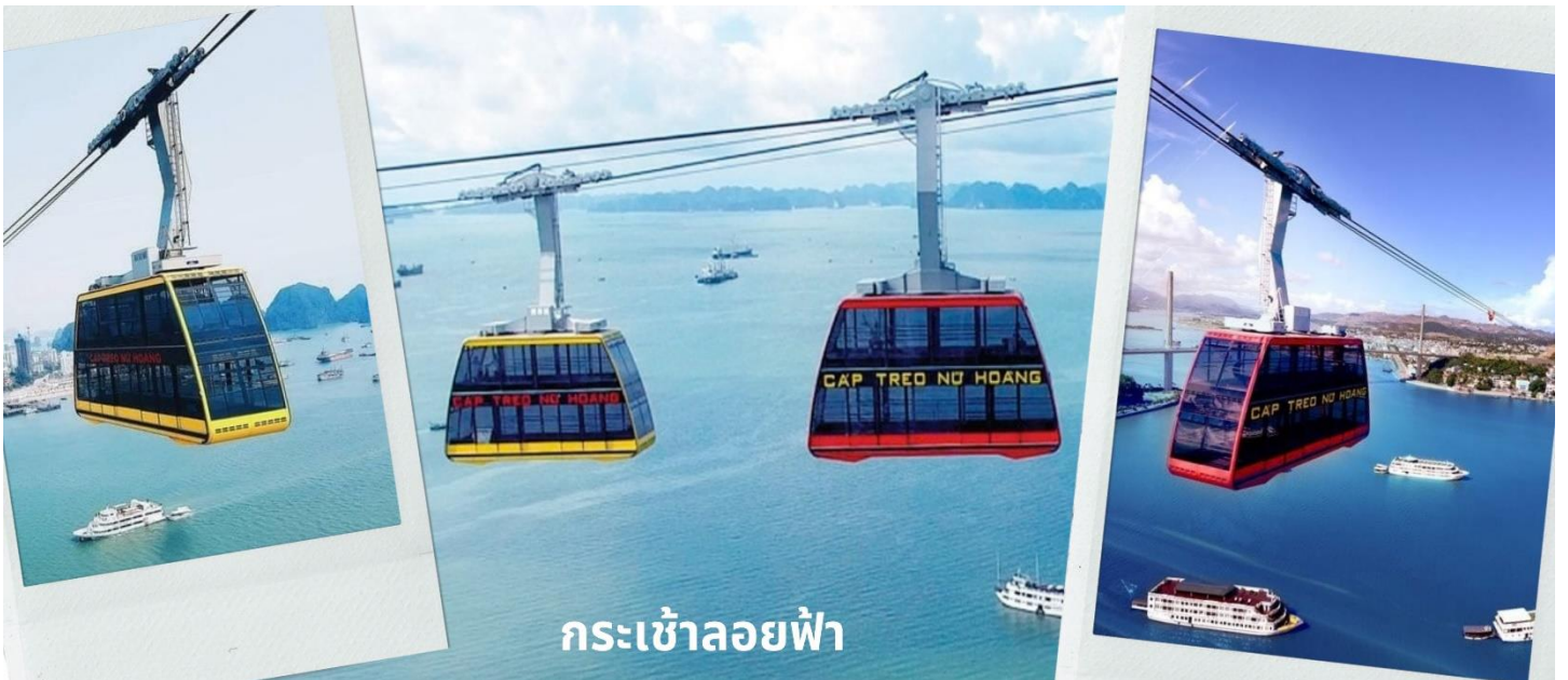
กระเช้าลอยฟ้า

จากนั้นนำท่านนั่ง Queen Cable Car กระเช้าลอยฟ้า 2 ชั้นที่ใหญ่ที่สุดในโลก จุคนได้มากถึง 250 คนต่อเที่ยว สามารถรับ-ส่งผู้โดยสารได้มากถึง 2,000 คนต่อชั่วโมง กระเช้าลอยฟ้า 2 ชั้นยิ่งใหญ่อลังการนี้เป็นส่วนหนึ่งของสวนสนุก Sun World Halong Park สร้างโดย Doppelmayr/Garaventa Group จากประเทศสวิตเซอร์แลนด์และออสเตรเลีย โดยมีความพิเศษที่สามารถทำลายสถิติโลก และได้รับการบันทึกลงใน Guinness World Records ถึง 2 รายการ คือ เป็นกระเช้าที่จุคนได้มากที่สุดในโลก และมีเสาคอนกรีตส่งกระเช้าที่สูงที่สุดในโลก ด้วยความสูงถึง 188.88 เมตร