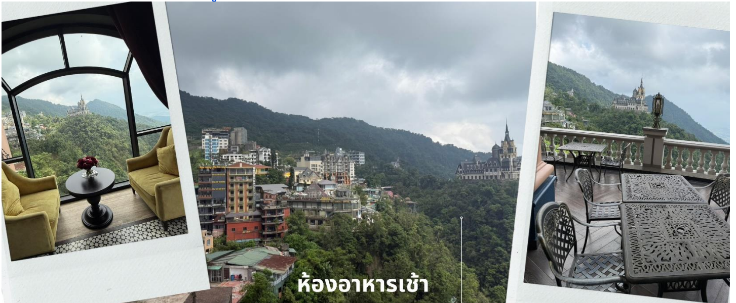
ห้องอาหารเช้า

เช้า รับประทานอาหารเช้า ณ ห้องอาหารของโรงแรม (4) ให้ท่านได้อิสระถ่ายรูปกับปราสาทตามด้าว ณ ห้องอาหารเช้าโรงแรมที่เราพัก