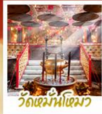
วัดเมฆน้ำเฒว