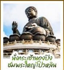
นั่งกระเช้ามองปิง ชมพระใหญ่ไถ่หวิน

นั่งกระเช้ามองปิงสักการะพระใหญ่ไถ่หวิน • วัดหวังต้าเซียน ขอพรสุขภาพ ความรัก วัดเขกงหมิว ขอพรองค์แชง โชคลาภ การเงิน และธุรกิจ • เทพเจ้ากวนไท ความซื่อสัตย์ เงินทอง ธุรกิจมั่นคง • เจ้าแม่กวนอิมรีฟลัสส์บีย์ ธิบพลังงานดี เสริมพลังฮวงจุ้ยที่รีฟลัสส์บีย์