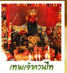
เทพเจ้ากวนไท