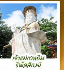
เจ้าแม่กวนอิมรีฟลัสส์บีย์