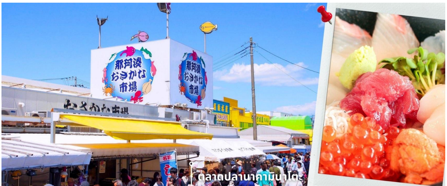
ตลาดปลานาคามินาโตะ

จากนั้นนำท่านเดินทางสู่ ตลาดปลานาคามินาโตะ Nakaminato Fish Market เป็นตลาดปลาที่ใหญ่และมีปลาสดๆ มากมายเทียบกันได้ที่ตลาดปลาซึกิจิ ตลาดปลานาคามินาโตะตั้งอยู่ตามแนวริมน้ำในเมืองมินะโตะ-ฮอนโซ