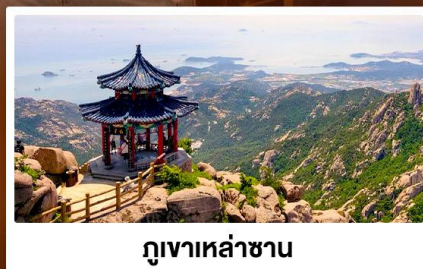
ภูเขาเหล่าซาน