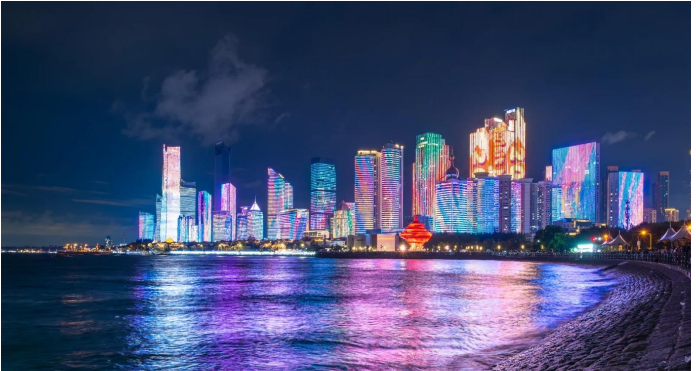
100 หลังเรียงรายตามแนวชายฝั่งที่ประดับประดาด้วยสีอันสดใส

เรือใบโอลิมปิกชิงเต่า ริมอ่าวฟูซาน มีทางเดินเลียบชายฝั่งที่ทอดยาว สามารถเดินเล่นริมทะเลชิลๆ เอนกายบนริ้วเพื่อชมทะเลช่วงพระอาทิตย์ตกดินอย่างเพลิดเพลินและเดินทางไปยังชายหาดสุดไวรัลของเมืองอย่าง ชายหาดไซเบอร์ฟังก์ (NO.3 BATHING BEACH) มีชื่อเรียกอีกอย่างว่า “หาดซานไห่เทียน” ดึงดูดกับเสน่ห์ของชายหาดที่เงียบสงบ เดินถ่ายรูปวิวทะเลในยามค่ำคืน ชมทิวทัศน์มุมกว้างอันยอดเยี่ยมของอ่าวฟูซาน และการแสดงแสงสีของตึกสูงในเมืองชิงเต่า ซึ่งมีอาคารสูงระฟ้ากว่า