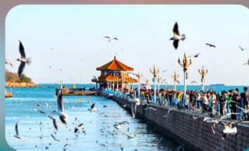
สะพานจันเฉียว