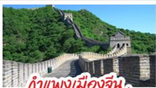
กำแพงเมืองจีน ด่านมู่เทียนยวี่

Universal Beijing - กำแพงเมืองจีนด่านมู่เทียนยวี่ (รวมกระเช้าขึ้น-ลง) พระราชวังโบราณกู้กง - หอฟ้าเทียนถาน - ซุปป์ิงกบนหวิงฝูจิ่ง และซานหลี่กุน เมนูพิเศษ สุกิมองโก, เป็ดปักกิ่ง, Michelin Guide ร้าน Tao Tao Ju