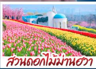
สวนดอกไม้บ้านฮวา