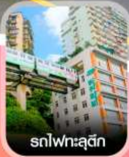
รถไฟทะเลตุ๊ก

✈️ คอนเฟิร์มออกเดินทาง ทุกพีเรียด 2 ท่านขึ้นไป