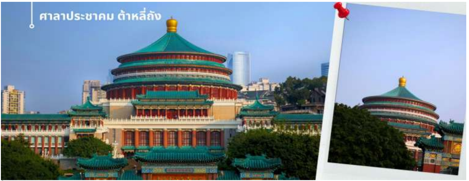
ศาลาประชาชน ต้าหลี่ถิง