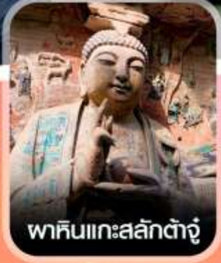
พาคินแกะสลักต้ำจู้