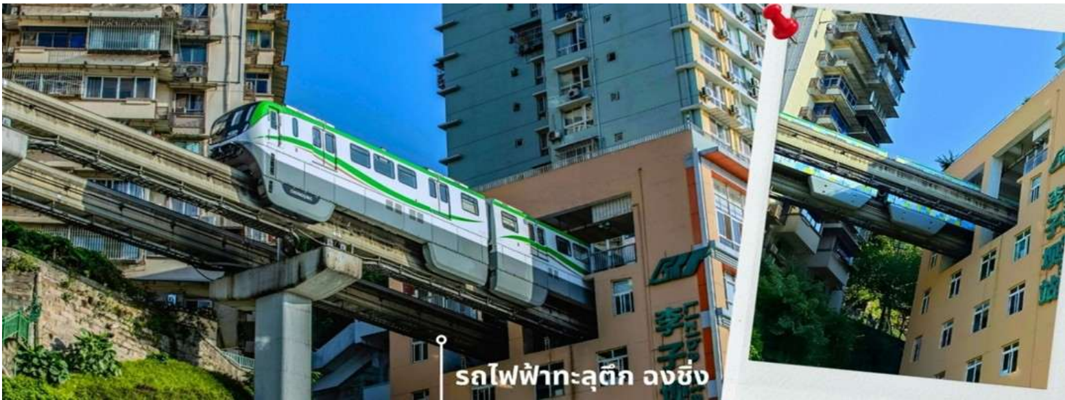
รถไฟฟ้าทะเลตุ๊ก ลงชิง

จากนั้นนำท่านนั่งรถไฟฟ้าทะเลตุ๊ก หรือ สถานี Liziba เป็นสถานีรถไฟฟ้าแบบชานชาลา สิ่งที่ทำให้สถานี Liziba มีชื่อเสียงไปทั่วโลกคือ “เส้นทางรถไฟที่วิ่งทะลุผ่านอาคารสูง 19 ชั้น” โดยมีระบบลดเสียงและแรงสั่นสะเทือน ทำให้ผู้ที่อาศัยอยู่ในตึกไม่ได้รับผลกระทบจากเสียงดังมาก กลายเป็นภาพอันน่าตื่นตาตื่นใจของผู้ที่มาเยือนทั้งนักท่องเที่ยวที่เดินทางมาเป็นครั้งแรก ผู้โดยสารบนขบวนรถไฟและผู้เข้าชมจากจุดชมวิวที่ต่างตื่นตันทึ่งไปตามๆกันกับการที่ได้เห็นรถไฟวิ่งทะลุตึกนี้ สถานี Liziba ได้รับการยกย่องให้เป็น 1 ในสถานที่สำคัญที่สะท้อนความเติบโตของจีนตลอด 70 ปี ซึ่งไม่ได้เกิดขึ้นโดยบังเอิญ รถไฟฟ้าทะเลตุ๊กนี้คือตัวอย่างของความอัจฉริยะในการออกแบบการคมนาคมในเมืองภูเขาแห่งนี้ให้ท่านได้สัมผัสประสบการณ์กับการขึ้นนั่งบนรถไฟเพื่อผ่านทะเลตุ๊กและเก็บภาพบรรยากาศ