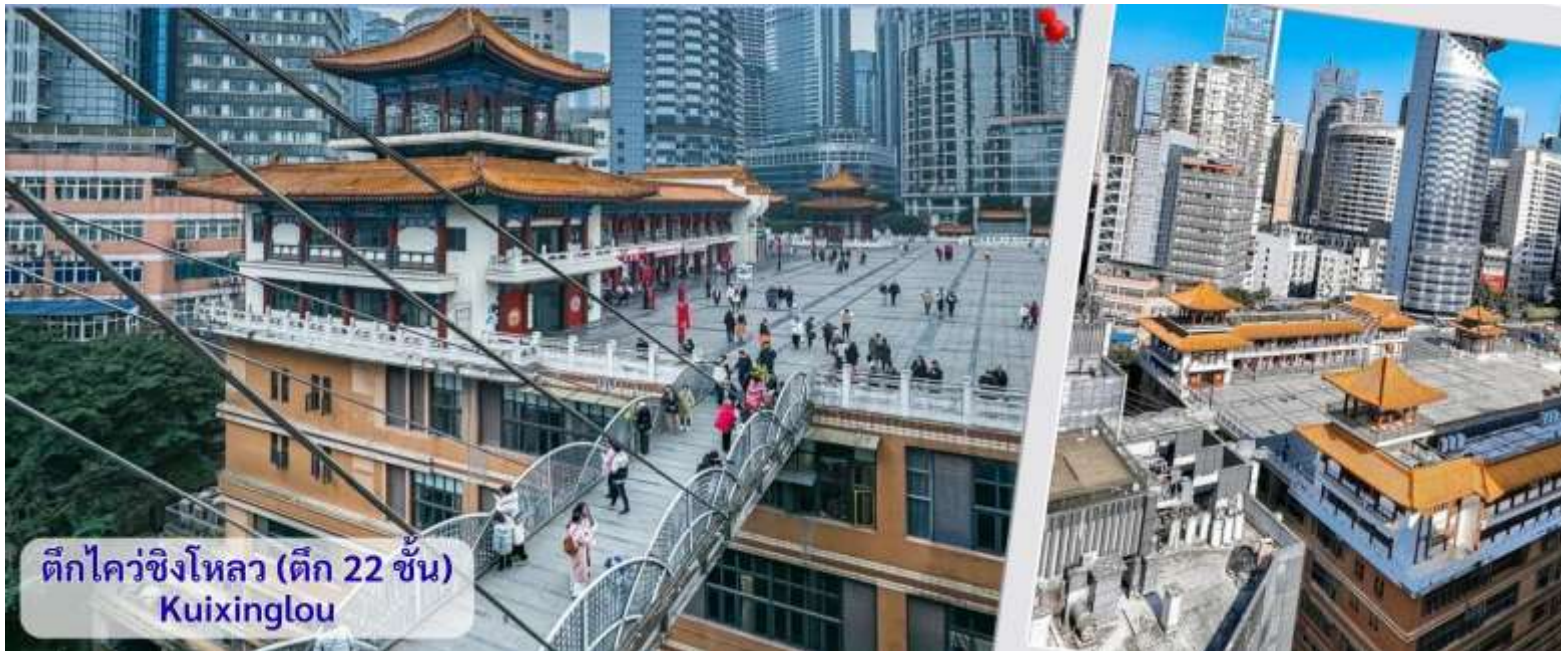
ตึกไควชิงโหลว (ตึก 22 ชั้น) Kuixinglou

จากนั้นอิสระถ่ายรูปหน้าตึกตะเกียบ ฉงชิ่ง(ด้านนอก) คือ ฉงชิ่งกั๋วไท่อาร์ตเซ็นเตอร์ (Chongqing Guotai Arts Center) เป็นแลนด์มาร์กสำคัญที่มีสถาปัตยกรรมคล้ายตะเกียบยักษ์สีแดงและดำวางซ้อนกัน เป็นศูนย์จัดแสดงงานศิลปะและสถานที่ท่องเที่ยวที่นิยมสำหรับการถ่ายรูป โดยเฉพาะในเวลากลางวันเมื่อเปิดไฟสวยงาม สิ่งก่อสร้างอันมีเอกลักษณ์ อาคารนี้ถูกวางโครงสร้างให้มีรูปร่างคล้ายกอง "ตะเกียบยักษ์" สีดำและแดงที่วางซ้อนกันเป็นชั้นๆ ที่ส่วนปลายของตะเกียบสีแดงจะมีตัวอักษรจีนคำว่า "กั๋ว" ประทับอยู่ ซึ่งมีความหมายถึง ชาติหรือประเทศ ส่วนที่ปลายตะเกียบสีดำ จะมีอักษรจีนคำว่า "ไท่" ประทับอยู่ ซึ่งหมายถึง ความเจียบสงบ หรือความอุดมสมบูรณ์