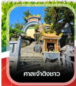
ศาลเจ้าดิ้งเซา