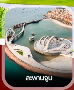
สะพานจูบ

✈️ คอนเฟิร์ม ออกเดินทาง ทุกพีเรียด 2 ท่านขึ้นไป