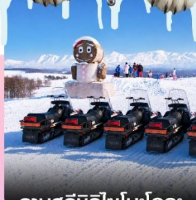
ลานสกีซึกิโซโนะโอกะ