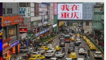
กวนอิมเจียว

*ทางบริษัทฯ ขอสงวนสิทธิ์ในการสลับโปรแกรมทัวร์ตามความเหมาะสมขึ้นอยู่กับสถานการณ์หน้างาน โดยคำนึงถึงผลประโยชน์ของลูกค้าเป็นสำคัญ