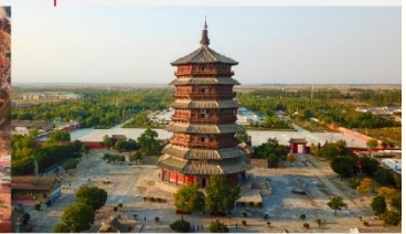
วัดเจดีย์ไม้ มู่ต้า

*ทางบริษัทฯ ขอสงวนสิทธิ์ในการสลับโปรแกรมทัวร์ตามความเหมาะสมขึ้นอยู่กับสถานการณ์หน้างาน โดยคำนึงถึงผลประโยชน์ของลูกค้าเป็นสำคัญ