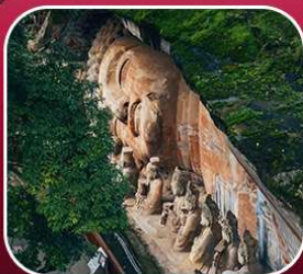
"ผาหินแกะสลักต้าจู้"