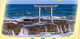
ศาลเจ้าโออาไรโอชิซึกิ