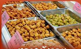
ตลาดมังจอบ