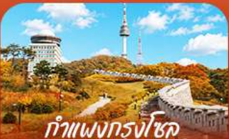
ทำแพนกรงโซล แบบคอมสแควร์

ออกเดินทางสู่เรื่องราวแห่งฤดูใบไม้เปลี่ยนสี สัมผัสความงดงามของเกาะบาบีและอุทยานแห่งชาติชอร์คซาน เพลิดเพลินกับความสุขเต็มอิ่มที่สวนสนุกเอเวอร์แลนด์ • เก็บภาพความประทับใจท่ามกลางทุ่งหญ้าสีทอง และไปมีหลากหลายที่สวนฮานิลปาร์ก • พร้อมชมวีทอคอยน์ชมจากแบบคอมสแควร์ • เต็มเต็มความสุข ด้วยการลิ้มลองสตรีทฟู้ดรสเลิศที่ตลาดมังจอบ • ก่อนเพลิดเพลินกับการช้อปปิ้งในกรุงโซลตลอดทริป