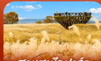
สวนฮานิลปาร์ก