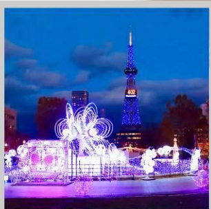
“SAPPORO WHITE ILLUMINATION”