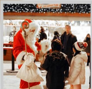
“ODORI GERMAN MARKET”